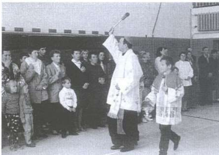
Moment poświęcenia obiektu przez ks. biskupa.