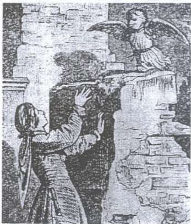
STRZYGA. Fragment, drzeworyt Drązkiewicza.

Inaczej nazywano je Mamonami albo Boginkami. Najchętniej przebywają w lasach, jarach, nad potokami, ale zawsze w miejscach niedostępnych ludziom. Ukazują się bardzo rzadko. Ci, którzy je widzieli, opisują ich postacie jako podobne do kobiecej z tym, że Mamuny mają szpiczaste głowy, a piersi tak długie, że aż sięgają kolan. Są bardzo małe, jak pięcioletnie dzieci i chodzą nago. Mamuny wchodzą nocą do domu przez okno albo dziurkę od klucza, aby zabrać nowonarodzone dziecko, a podrzucić swoje. Mogą to zrobić jedynie do momentu chrztu dziecka lub wywody matki. Jeżeli jednak udało się zamienić dziecko na Mamonię, rozpoznać to można dopiero w dzień, bo nie ma ono jeszcze szpiczastej głowy, ale jest ona bardzo duża, podobnie brzuch, a z siebie wydala bardzo dużo odchodów. Wówczas należy Mamonię położyć na nawozie, uderzyć 3 razy prętem z dziewięcioma gałązkami i za każdym uderzeniem wypowiadać słowa: "weź swoje a oddaj moje". Mamuna wtedy przychodzi i oddaje dziecko, a swoje Mamonię zabiera. Istnieje sposób, aby nie dopuścić do takich zmian. Należy do kołyski położyć "bagnięta" (bазie) wyjęte ze święconej palmy, bo mają one moc odstraszenia demona. Ponadto Mamuny, wedle wierzeń ludowych, ssąły piersi kobietom karmiącym (stąd brały się niekiedy braki pokarmu), dziewczynkom, a zdarzało się czasami, że i mężczyznom. Poznaje się to po obrzmieniu piersi oraz ogólnym osłabieniu. Nie ma na to lekarstwa, trzeba poczekać, aż Mamuny przestaną ssać (na szczęście trwa to