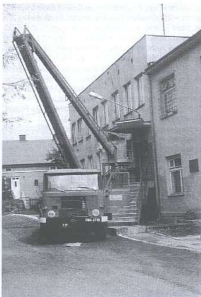
Na zdjęciu: prace malarskie przy głównym wejściu.